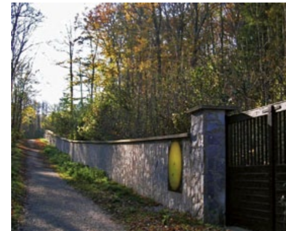
Planeten-Wanderweg an der Außenmauer des Lainzer Tiergarten

Fr 17.9., 19h (Ersatztermin 18.9.) Beobachtungsabend Tullnerbach für Mitglieder mit und ohne Fernrohr