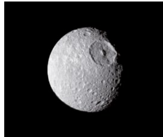
Saturnmond Mimas mit Impaktkrater; Credit: NASA/JPL/Space Science Institute

Fr 7.5., 19h: „Kleinkörper im Sonnensystem (Asteroiden, Kometen, Meteoroiden). Sind sie eine Gefahr für die Erde?“ mit Thomas Schnabel